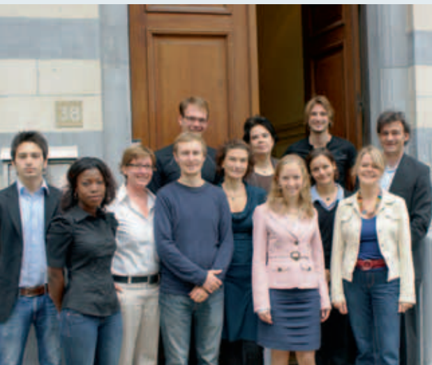
La oficina de la FES en el barrio europeo de Bruselas.

La oficina europea de la Friedrich-Ebert-Stiftung (FES) con sede en Bruselas desarrolla sus actividades en Bruselas y Estrasburgo. Se inauguró en el año 1973. La oficina europea participa en el proceso de integración europea, fomenta los intereses de la República Federal de Alemania en Europa y colabora en la definición de las relaciones exteriores de la Unión Europea.